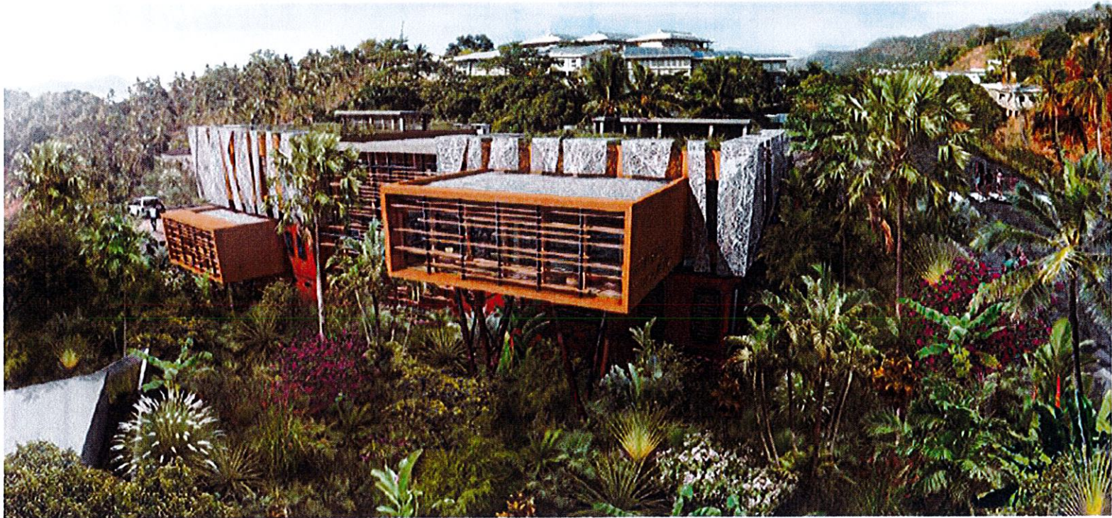
Figure 1: Insertion du projet dans son environnement- extrait de l'APS